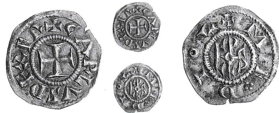
13. Milano, Carlo Magno. Denaro con monogramma. Ag g 1,70