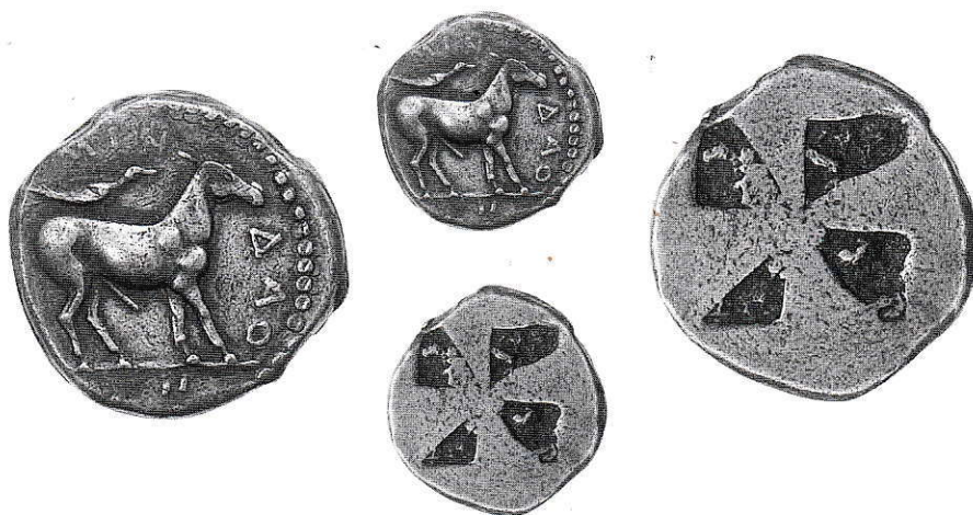
15. Macedonia, Mende. Distatere. Ag g 12,87