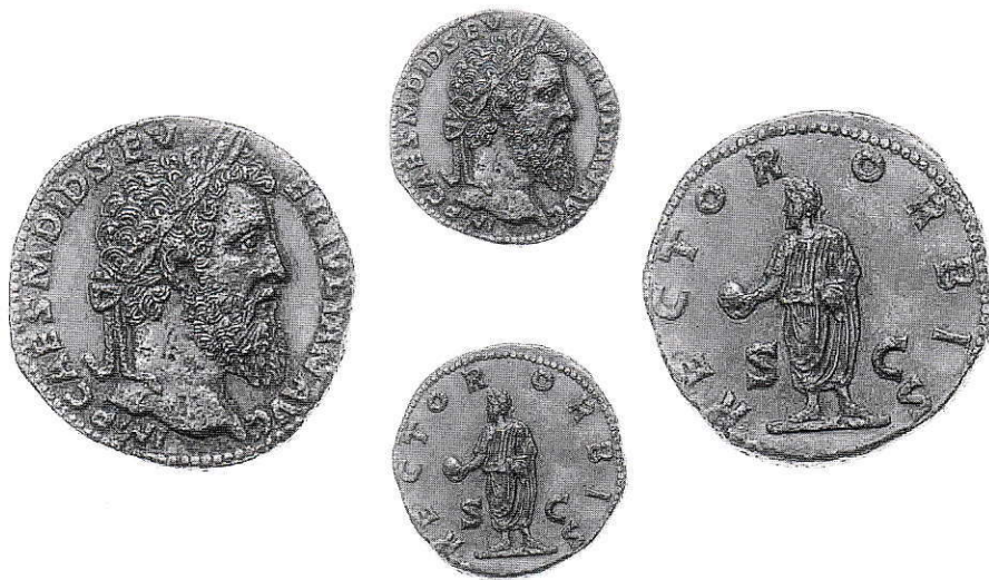
14. Impero Romano, Didio Giuliano. Sesterzio. Ae g 18,52