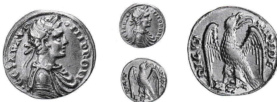
18. Messina o Brindisi, Federico II. Augustale. Au g 5,24