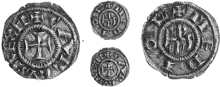
12. Milano, Carlo Magno. Denaro con monogramma. Ag g 1,46