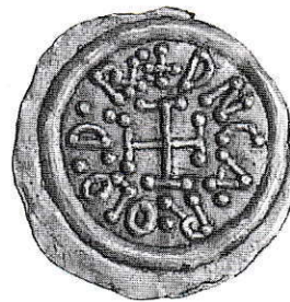
5. Milano, Carlo Magno. Tremisse in oro. g 1,06