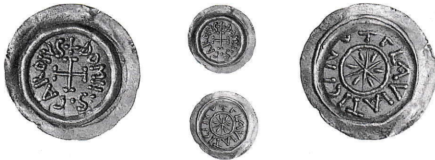
6. Pavia, Carlo Magno. Tremisse in oro. g 0,96