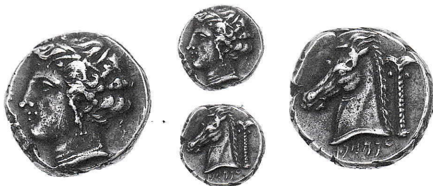
17. Siculo Puniche, Tetradramma. Ag g 17,12