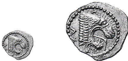
2. Etruria, Populonia. Da 25 Litre in oro, g 1,43