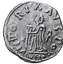
3. I Merovingi. Tremisse a nome di Giustiniano. Au g 1,22