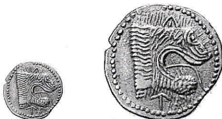
1. Etruria, Populonia. Da 50 Litre in oro, g 2,68

Di recente è tornato alla ribalta un gruppo di monete false che già da 2 o forse 3 anni viene proposto sul mercato. La realizzazione di alcuni falsi è di estrema pericolosità e pensiamo che la maggior parte di queste riproduzioni risalga al XVIII o XIX Secolo. Il luogo di provenienza dell'intero gruppo è la Svizzera, per stessa ammissione di chi le propone. Segnaliamo inoltre che in questi 2 anni si sono alternati almeno due differenti venditori i quali, al fine di ingolosire l'acquirente, sostengono di aver già ricevuto un'offerta, ora di oltre 30.000 franchi svizzeri da un non ben identificato Sig. Kunz o Kunst, ora di Lire 50.000.000 da un privato del meridione. Fatto sta che, inspiegabilmente ma fortunatamente, l'intero gruppo non si è ancora accasato, nonostante che alcuni commercianti - sappiamo per certo di un filatelico - abbiano formulato un'offerta. Altra cosa strana è data dall'elenco che queste persone distribuiscono senza parsimonia, quasi si trattasse di un listino di vendita; redatto a macchina da una persona senza alcun dubbio competente della materia, presenta una numerazione sfalsata e questo fa pensare che le suddette monete facessero inizialmente parte di un gruppo ben più numeroso.