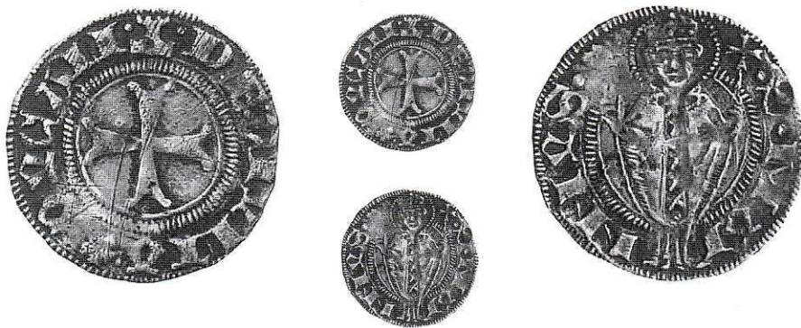
8. Cittaducale, Monetazione Autonoma. Doppio Bolognino. Ag g 1,22