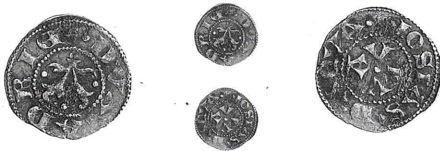
7. Atri, Giosia d'Acquaviva. Bolognino. Ag g 0,64