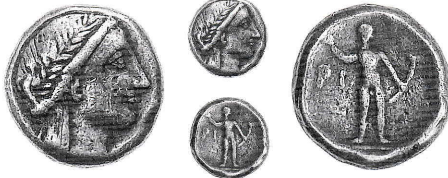
16. Creta, Stater. Ag g 11,97