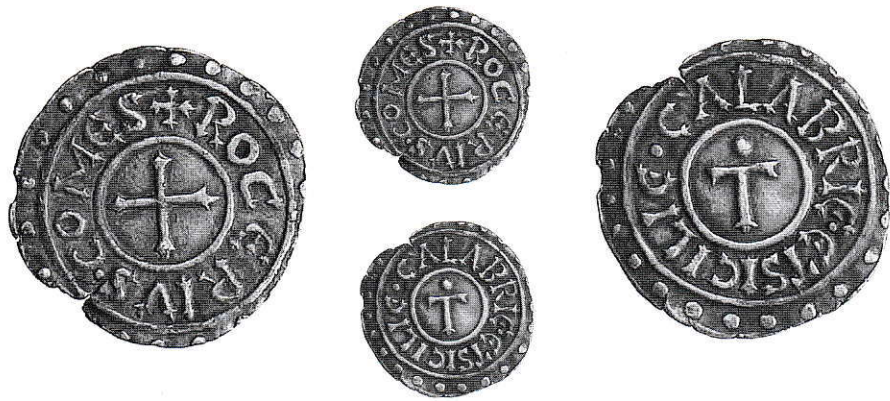
11. Mileto, Ruggero I. Denaro con croce. Ag g 1,90